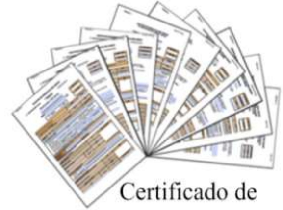
Certificado de Informaciones Previas